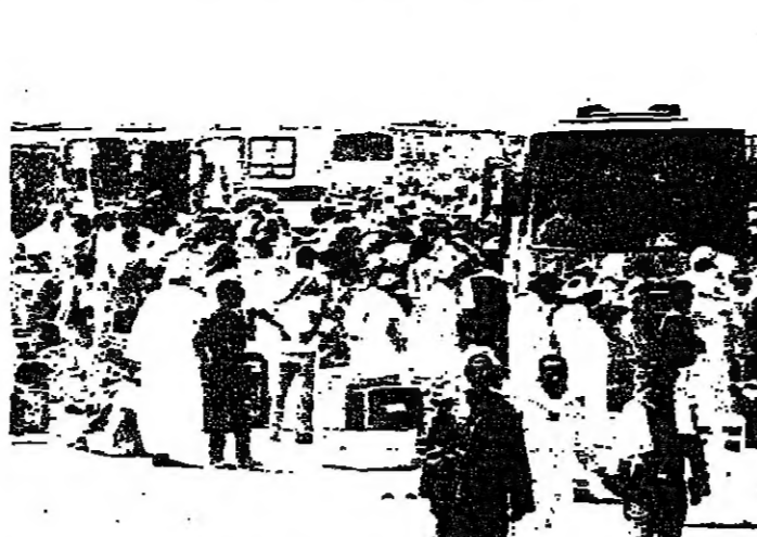
الرف المصريون على الجانب الأردني من الحدود مع العراق

يقوم جسر جوي يومي بنقل آلاف من النازحين المصريين الذين فروا من العراق والكويت لاجدوا أنفسهم في صحراء الأردن يتظنون فرصة للسفر. ويصعب أحد رجال الشرطة قائلاً: «اصطفا هنا. اصطفا سريعاً، وهو يلوح بعضاً في وجوه مصريين يتصبون عرقاً يحملون حقائب وصناديق وهم يجوبون في طائرة نقل عسكرية من طراز سي ١٣٠، في ميناء العقبة الأردنية الجنوبي. ويجوز النازحون وراحمهم امتعتهم الهزيلة وهم يصرخون في بعضهم البعض ليصعدوا سلم الطائرة. وخلف النازحون الذين بدأ عليهم الإرهاق بعد رحلة طولها ١٧٦٠ كيلومتراً وفحلات في الشاحنات المكتظة وراحمهم كواماً من المخلفات في صالة السفر في مطار العقبة الدولي. ويتجذب الجسر الجوي نقطة الخروج الخفية الأساسية لحدود النازحين وهو الطريق البحري من ميناء مصري في العراق و١٢٠٠٠٠ آخرين في